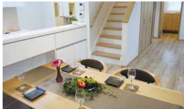
「家族のコミュニケーションがとれるようにリビング階段にしました」とご主人。階段はまだ幼いお子さんと並んで上れるよう幅を広く。階段下収納をリビングで使えるのも便利。