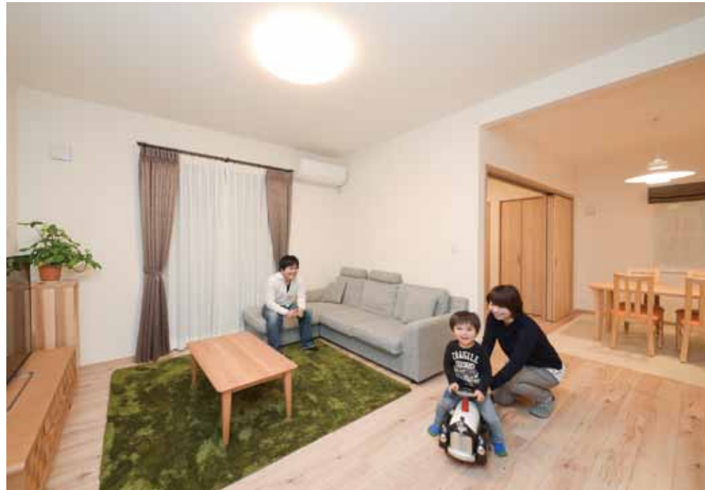
子育て世代に手が届く価格で希望のデザインと性能を叶えた住まい。D邸は耐震等級・省エネ等級ともに最高等級の認定を受けた長期優良住宅。高気密・高断熱で昼間の暖かさを保ち、夜もぽかぽか。「温度差が激しかった以前の家と比べると快適度が全然違う」と奥さま。