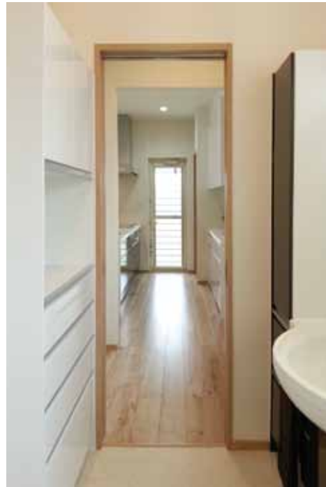
キッチンから水回りへ一直線に続く家事動線は、料理をしながら同時に洗濯などの作業がラクにできる優秀プラン。