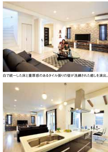
アイランドキッチンは、家事をしながら子どもたちを見守る奥さまの基地。