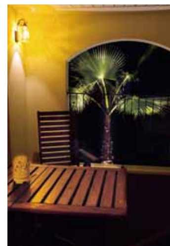
ただ住むだけではない、暮らしを楽しむ、癒される場所としての住宅。