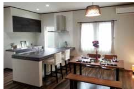
濃い目のフローリングで、落ち着いた雰囲気のダイニングキッチン。