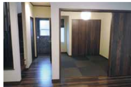
部屋を完全に仕切らず、ひとつの空間として統一感を持たせています。