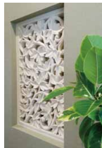
家の顔とも言える玄関には、バリ産の砂岩レリーフを。ゲストをリゾートの雰囲気でお迎え。

海外のリゾートホテルで感じる心地いい光と風。テレビに映し出されるゆったりとした癒しの空間。あの圧倒的な開放感に憧れたことはありませんか。デザインリゾート株式会社は、提案しているのは、休暇で訪れたリゾートホテルのような癒しを満喫できる住まいです。「感動をお贈りすることを保証する」をコンセプトに、普通の家では物足りないと感じている人に、日々の暮らしを楽しむための家を提供しています。