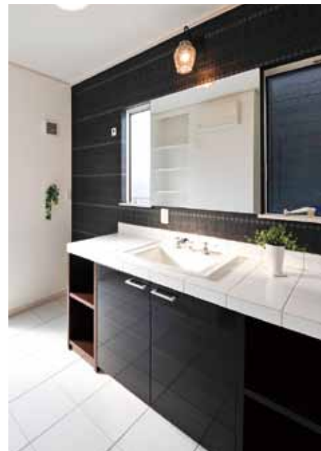
輸入品の洗面ボウルと水栓カラン、床のタイルでホテルのように上質。