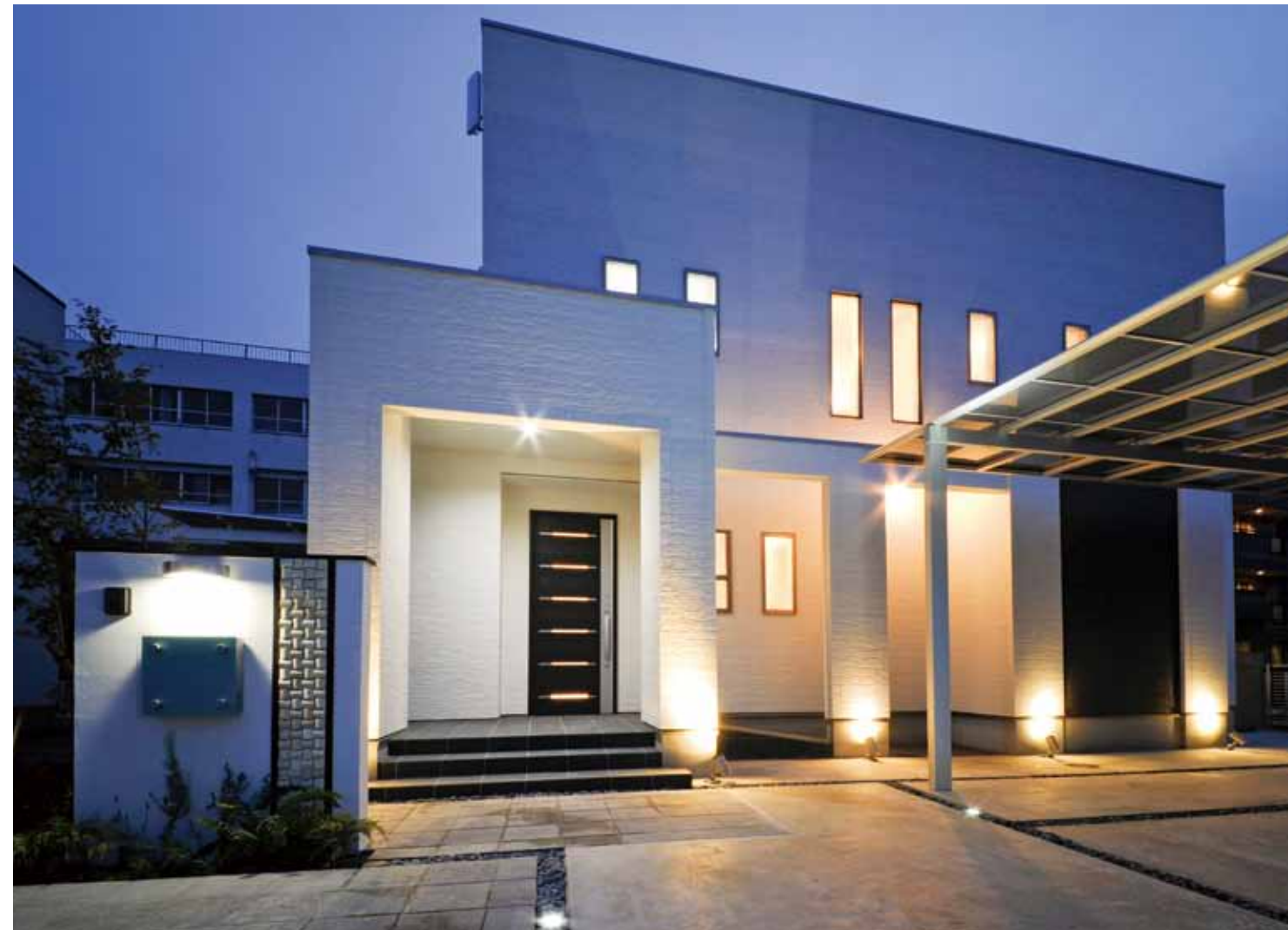
上質な邸宅をグレードアップし、防犯にも効果を発揮するエクステリアのライトアップ。表札やモザイクタイルはバリで特注。