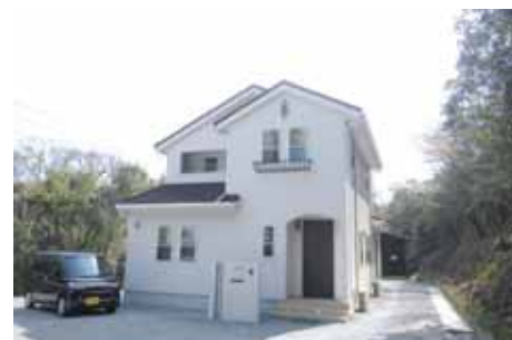
日常がリゾートになる、そんな住まいを作りませんか。