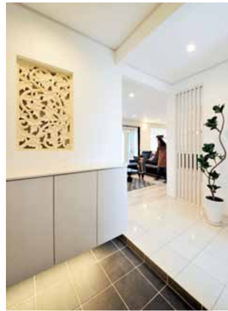
玄関にはデザインリゾートの名刺代わりとも言えるバリの砂岩レリーフを壁に埋め込みました。シンプルな玄関のアクセントになっています。