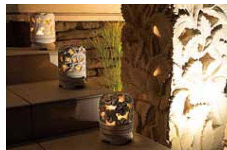
リゾート感あふれるエントランスの照明デザイン。