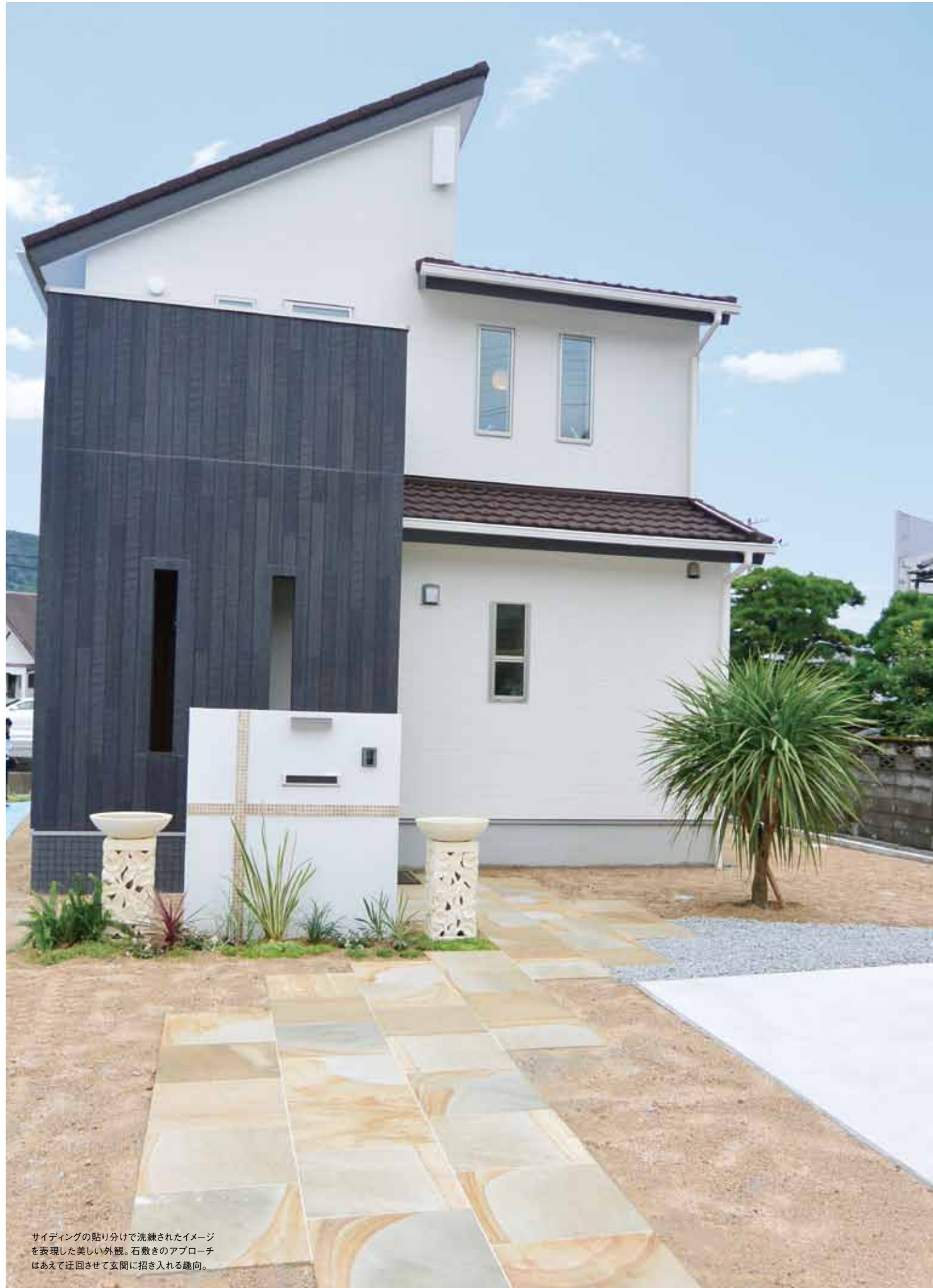
サイディングの貼り分けで洗練されたイメージを表現した美しい外観。石敷きのアプローチはあえて迂回させて玄関に招き入れる趣向。