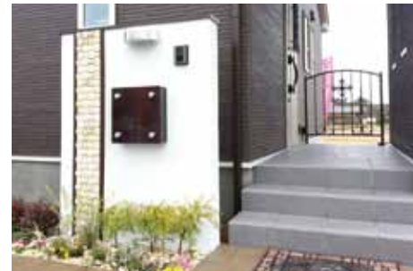
表札やモザイクタイルはバリで特注。手摺はブルーのステンドグラスで彩り。