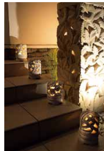
エントランスの照明デザインもリゾート感たっぷり。

海外のリゾートホテルで感じる心地いい光と風。テレビに映し出されるゆったりとした癒しの空間。あの圧倒的な開放感に憧れたことはありませんか。デザインリゾート株式会社は、提案しているのは、休暇で訪れたリゾートホテルのような癒しを満喫できる住まいです。「感動をお贈りすることを保証する」をコンセプトに、普通の家では物足りないと感じている人、日々の暮らしを楽しむための家を提供しています。