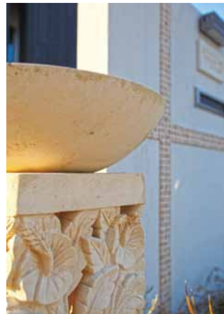
バリ産の砂岩門柱&鉢でゲストをお出迎え。