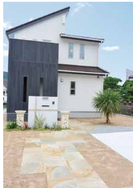
サイディングの貼り分けで洗練されたイメージに仕上げた美しい外観。