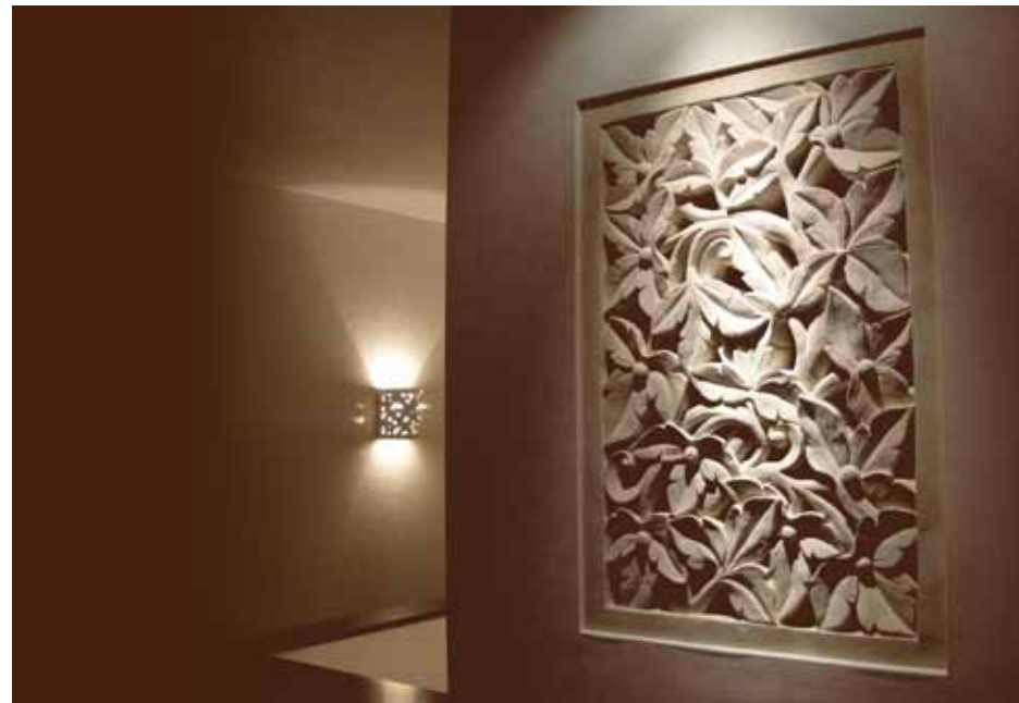
デザインリゾートのシンボルである砂岩レリーフ。バリ直輸入のタイルやオブジェが非日常空間を演出。