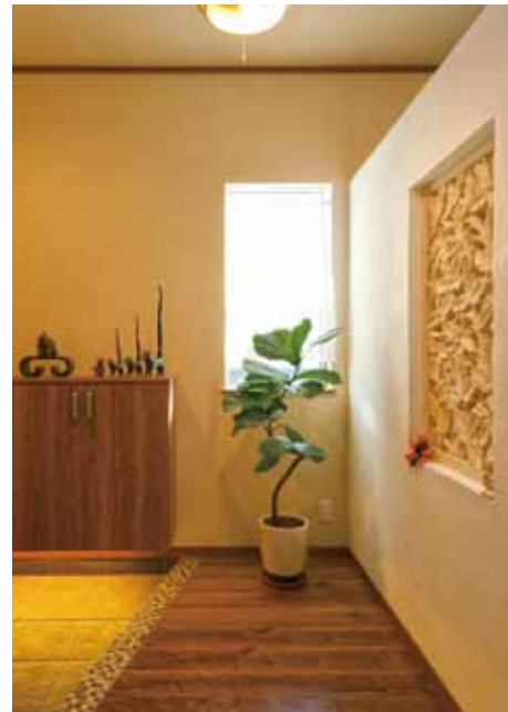
玄関収納下に間接照明を施し、温もりのある雰囲気。