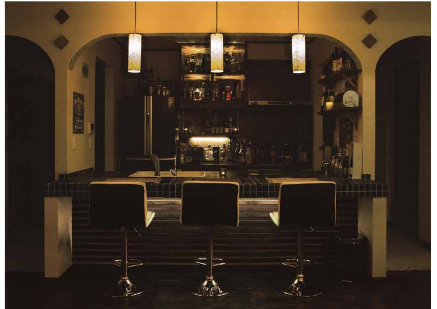
シックな大人感ただよふバーカウンター。リゾートホテルの雰囲気を演出。