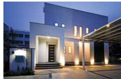
ライトアップで幻想的な雰囲気に。リゾートのエッセンスを。