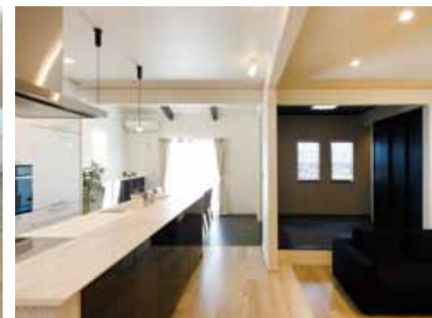
キッチンを中心とした間取り。キッチンから洗面、勝手口へと続く家事動線も確保しています。