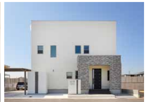
ワンランク上の暮らしを叶えるシンプル&モダンな住まい。シャープな外観にアクセントを添えるゲートの色分けは奥さまのアイデアを採用。