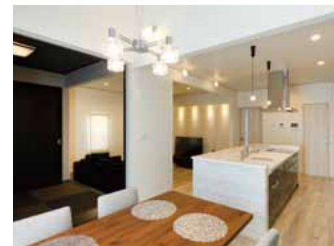
開口部を増やしながらも耐震等級3をクリア。デザイン性を損なうことなく、住性能を高める技術とアイデアにはご夫妻も脱帽。