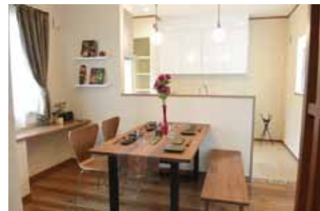
家具も床の色と合わせて統一感を持たせています。