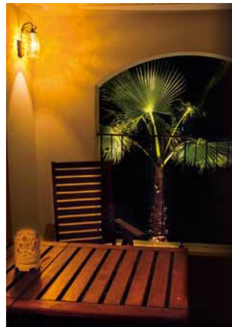
ただ住むだけでなく、暮らしのなかに癒しの空間を。