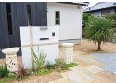
バリ産の砂岩門柱&鉢でゲストをお出迎え。

そんな開放的な間取りを可能にしているのは、ハイレベルな高気密・高断熱仕様、エネルギーロスが少なく、夏涼しい暮らしが実現できるのです。また、家の印象はエクステリアとインテリアによっても大きく変わります。輸入雑貨も扱うデザインリゾートでは、バリから直接取り寄せるレリーフやタイル、オブジェなどにより、家の内外をトータルで装ってくれます。ディテールにまでこだわること、感動的な非日常空間が完成します。