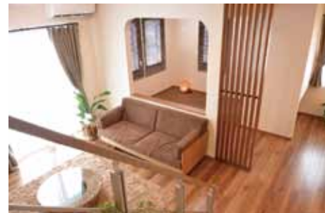
アールの垂れ壁や格子、観葉植物が温かみを添えるリビング。