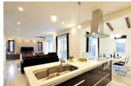
中庭を囲むL字型のLDKは明るくラグジュアリーな雰囲気。