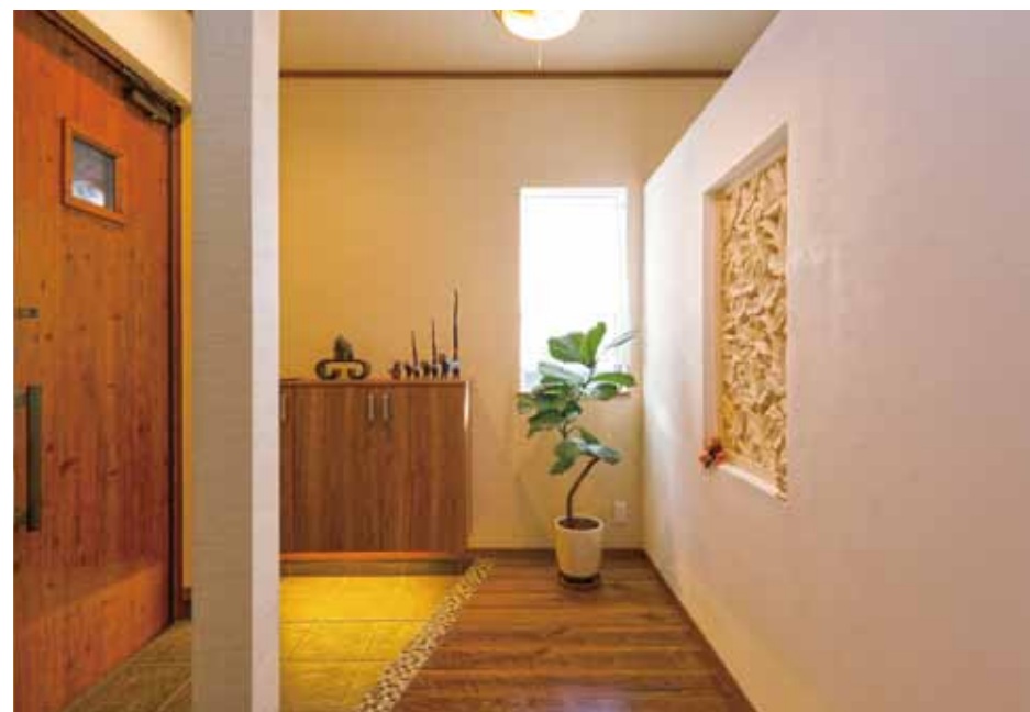
一步入ったとたんに非日常の空間。まさに「自宅リゾート」になります。