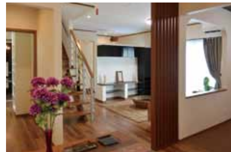
空間を仕切らずゆったりとした広がり演出。