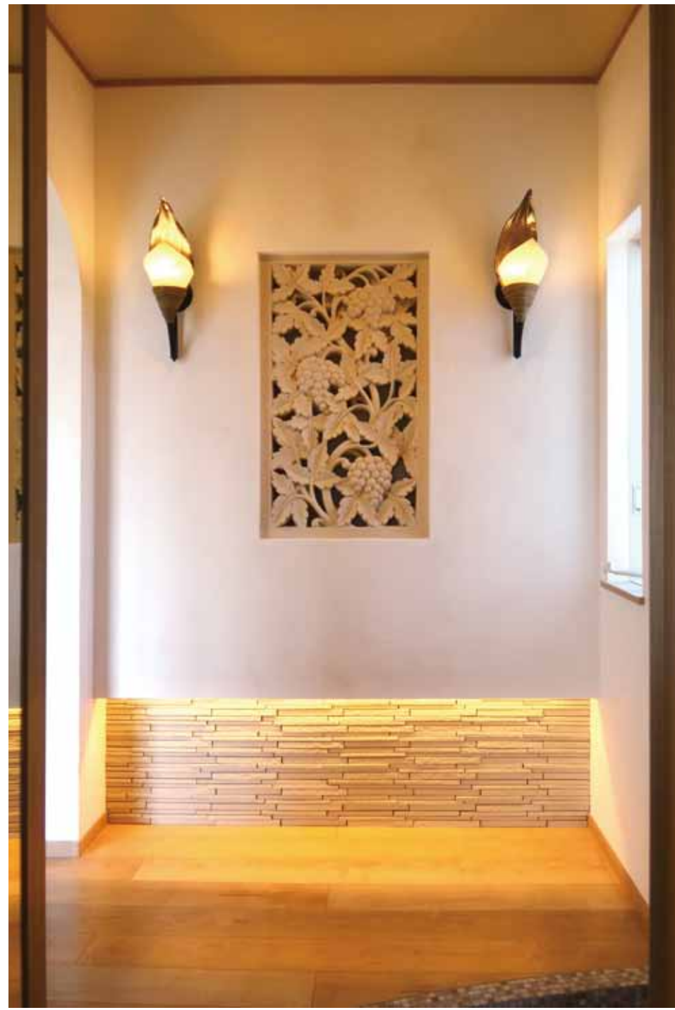
デザインリゾートのシンボル、砂岩レリーフ。エントランスや玄関ホールにリゾートの風を吹き込みます。