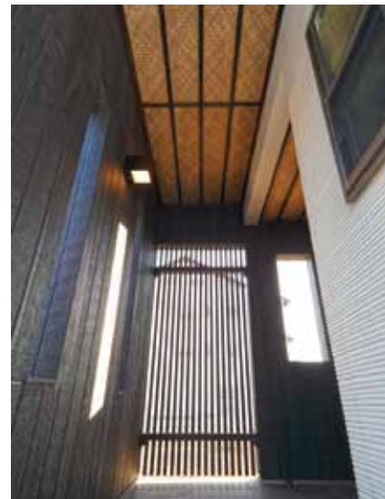
エントランスでは網代天井がエキゾチックな雰囲気を演出。